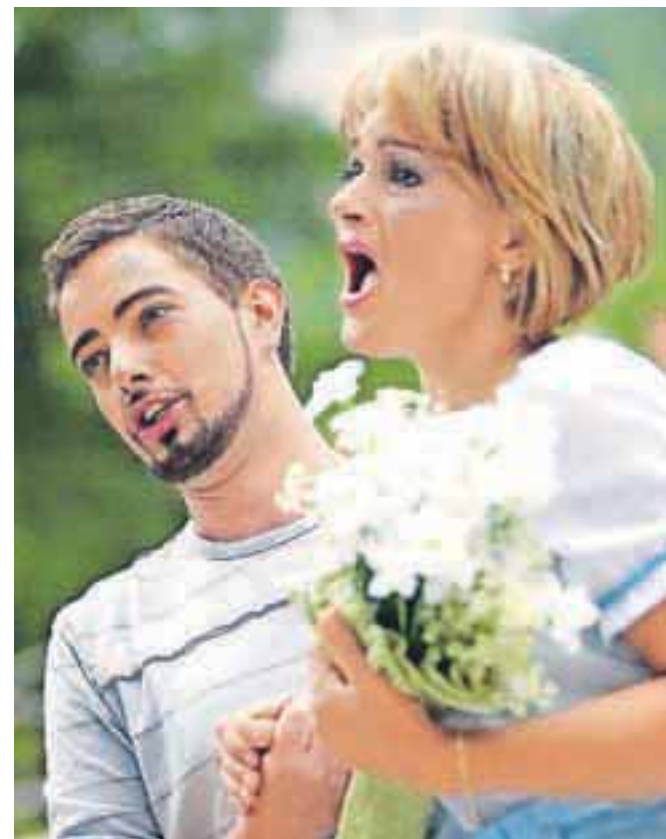
Planinska roža v dolini Vrata