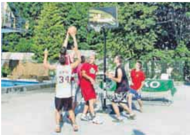
Košarkarji v igri tri na tri