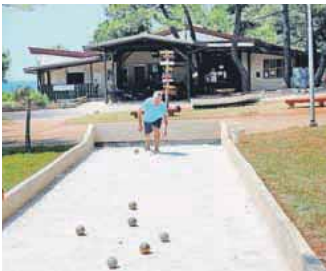
Letovišče Pinea v Pineti pri Novigradu se letos ponaša s prenovljenim baliniščem, novimi igrali in številnimi prenovljenimi nadstreški.