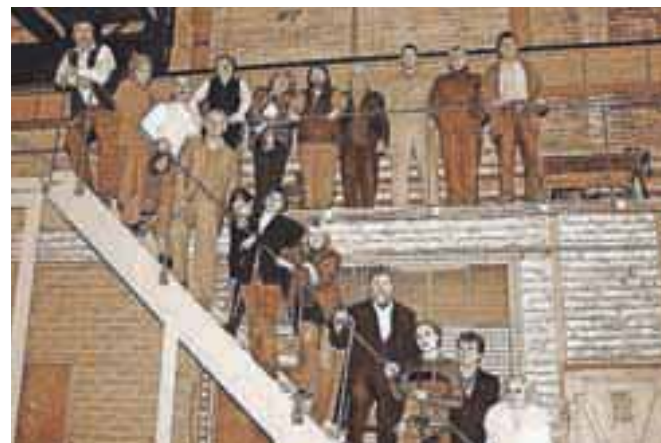
Drama Polom v proizvodni hali