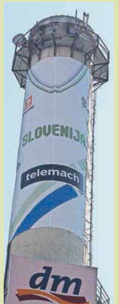
Dimnik, "oblečen" v dres slovenske košarkarske reprezentance, vabi na EuroBasket 2013.