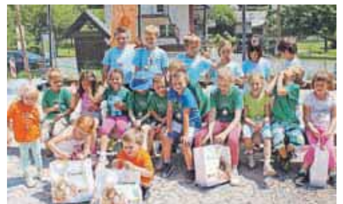
Udeleženci otroške olimpijade

do športa, iger, razvedrila in druženja. V različnih športnih in družabnih igrah je v treh starostnih skupinah sodelovalo okoli trideset otrok članov društva in drugih krajanov iz krajevne skupnosti. Za sodelovanje so vsi prejeli kolajne. Ni manjkalo drugega prijetnega programa in sladkih dobrot, pri izvedbi iger in celotnega programa so na pomoč priskočili starši otrok. Olimpijada je čudovito uspela ob pomoči sponzorjev, z njo pa so na najlepši način začeli praznovanje 25-letnice društva.