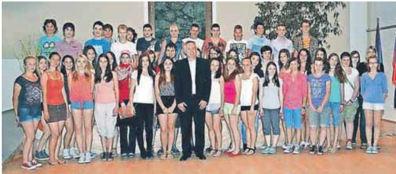
Odličnjaki z županom