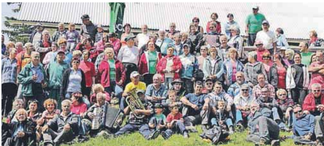
Udeleženci pohoda in srečanja na Hruščanski planini

krajevne skupnosti Boris Dolžan. V kulturnem programu so sodelovale pevke in pevci mešane skupine Nagelj pri domačem kulturnem društvu pod vodstvom novega zborovodja Francija Rihtarja. Lep sobotni dan so vsi izkoristili za prijetno druženje ob pesmi in klepetu, organizatorji so poskrbeli za dobro postrežbo, vsi udeleženci pa so za darilo prejeli majice. Na Hrušici vsa leta ohranjajo tudi spomin na težke dneve narodno-osvobodilnega boja. Letošnja komemoracija v spomin na 45 ustreljenih talcev bo 27. julija ob 19. uri pri spomeniku na Belem polju.