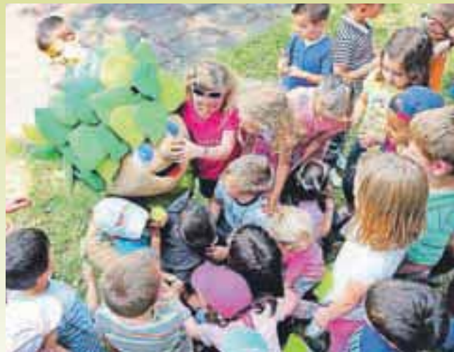
Otroci so bili navdušeni nad Lipkom.