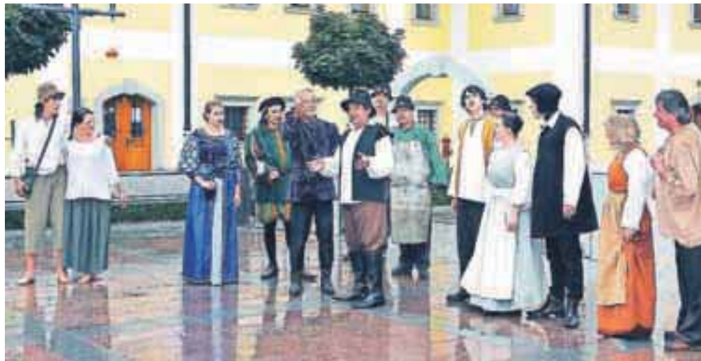
Plavž na Stari Savi