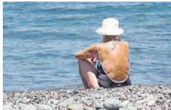
Večina nasilja nad starejšimi je skrita ...