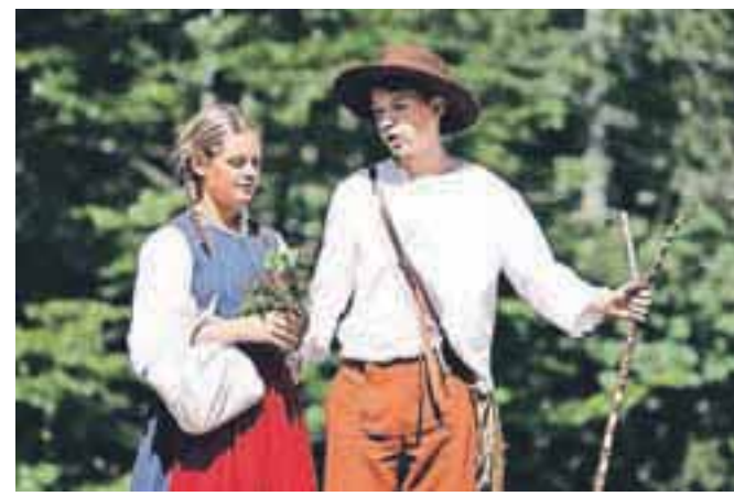
Srečno, Kekec v dolini Vrata