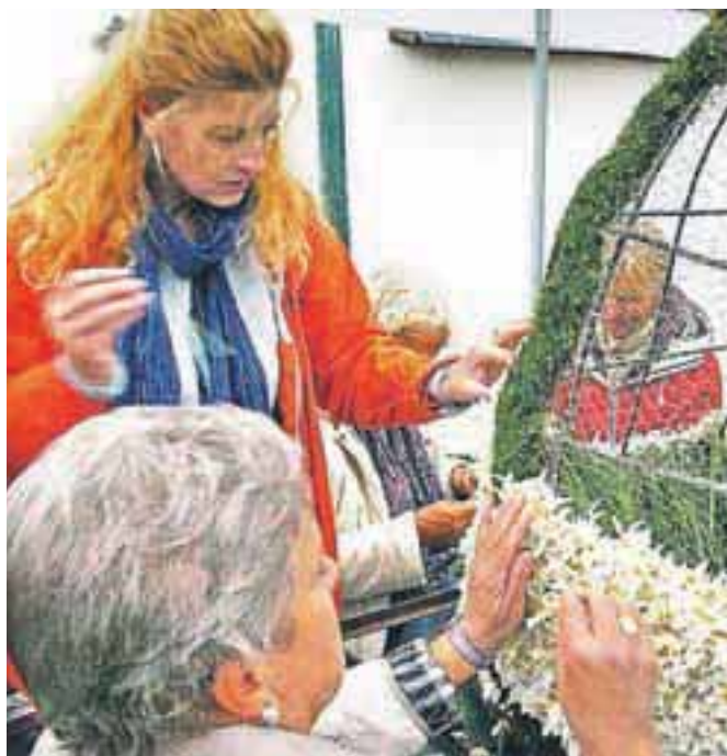
Delavnica izdelave narcisnih skulptur