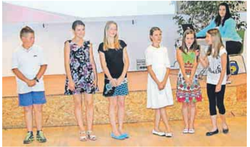
Učenci OŠ Koroška Bela so predstavili poslovno idejo podjetja Kva dogaja, d. o. o.